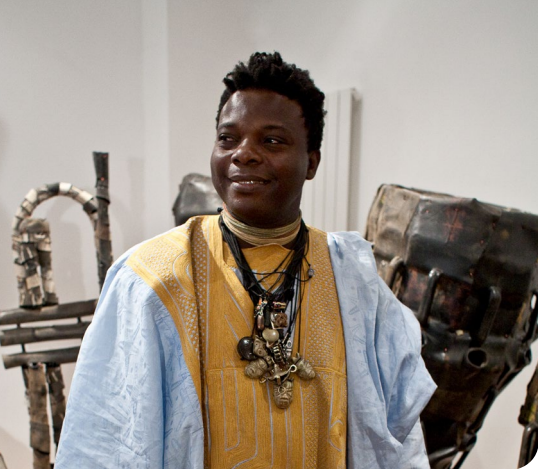
Romuald Hazoumè